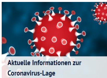
Aktuelle Informationen zur Coronavirus-Lage